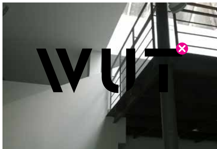
STOSOWANIE ZNAKU NA BARDZO BOGATO ZDOBIONYCH TŁACH